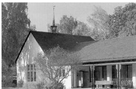
Kapelle und Aula des MBH

Das primäre Anliegen des Vereins ist der Erhalt und der Fortbestand des Martin-Butzer-Hauses das in seiner fast 50-jährigen Geschichte hunderttausendfach vorübergehende Heimat für Kinder, Jugendliche und Erwachsene war.