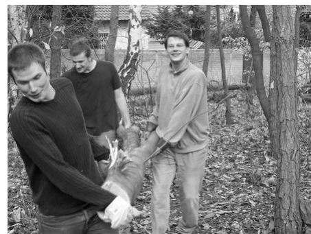
Förderverein beim Arbeitseinsatz für das MBH

Nun hoffen wir stark, dass die Synode diesem Vorschlag folgt und das Martin-Butzer-Haus schon in 2007 renoviert wird.